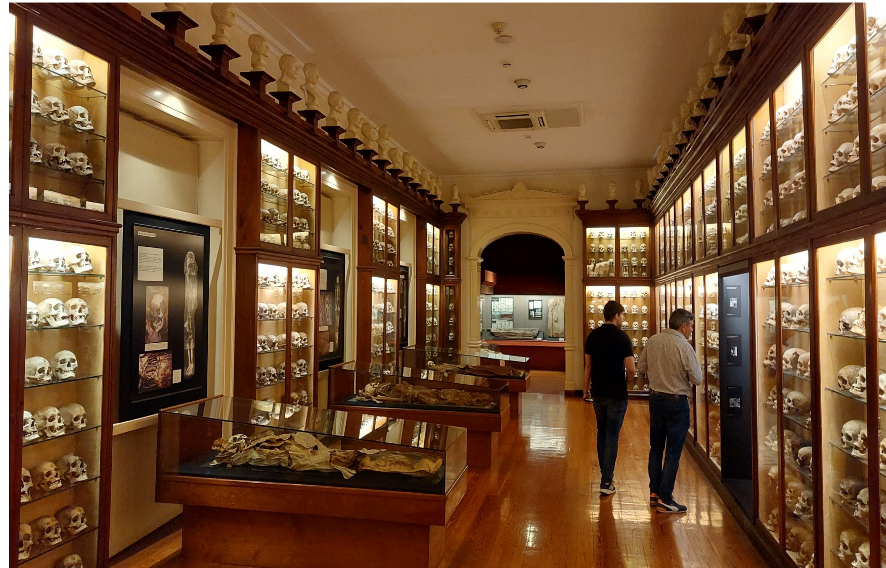
Aspecto actual de la sala de antropología física, en la que permanece la colección de bustos.