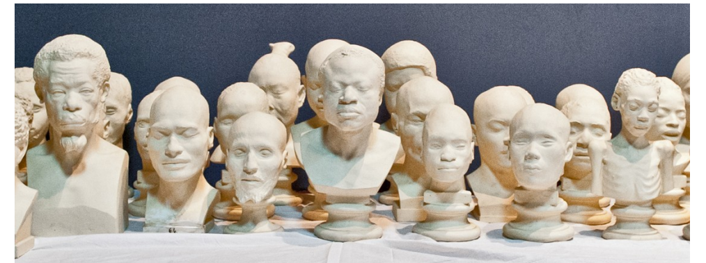
Algunos de los bustos de la colección durante unos trabajos rutinarios en 2014.

En el presente continúa siendo una colección muy apreciada, hasta el punto de ser demandada en préstamo por otras entidades culturales. De aquellos estudios antropológicos del siglo XIX, que emplearon copias de rostros de las distintas etnias y retratos fotográficos con posterioridad, han surgido también intervenciones artísticas, como la exposición infográfica Tropologías , del madrileño Andrés Pachón, celebrada en el Museo Nacional de Antropología en el año 2015 y basada en documentos fotográficos del XIX, en la que se emplearon, entre otros recursos, fotografías de tipos africanos enviadas al citado museo por Ripoche en 1900, procedentes del Muséum National d'Historie Naturelle; o Todo aquello que no está en las imágenes , de la brasileña Rosângela Rennó, y Madre , de la grancanaria Teresa Correa, celebradas, respectivamente, en el Centro Atlántico de Arte Moderno durante el año 2014 y en el Centro Insular de Cultura del Cabildo de Lanzarote entre 2021 y 2022.