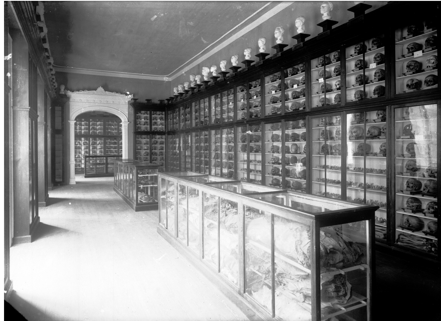
Bustos coronando las vitrinas de la sala dedicada a la antropología física.