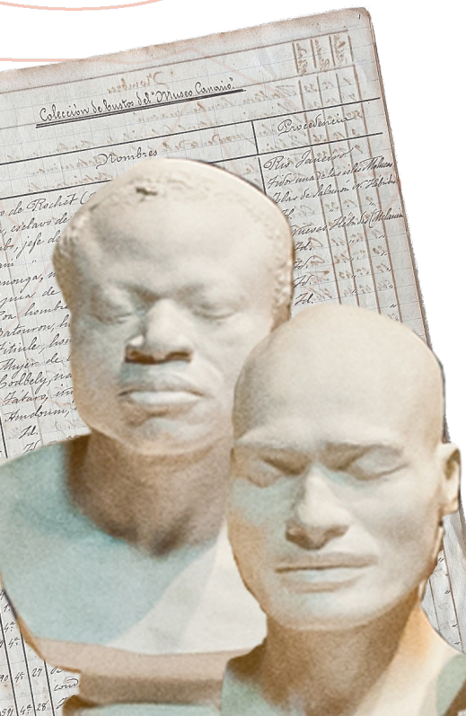
Colección de bustos de El Museo Canario. (fragmento).