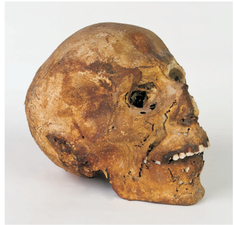
Vista lateral derecha del cráneo. Conserva tejidos blandos en ojo, nariz y oreja.