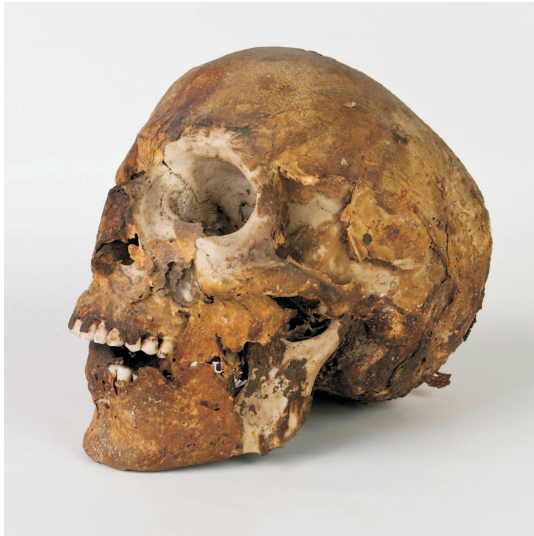
Vista lateral izquierda del cráneo. Conserva restos del pelo.