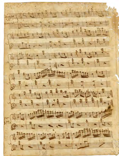
Tema de Mozart variado. Tema principal [ES 35001 AMC/MCC 049.026]

que se basa la composición fue tomado por Lentini de La Flauta mágica , estrenada por el compositor austriaco en 1791. La primera representación de esta ópera se produjo casi 30 años antes de que sirviera de inspiración para nuestro autor, pero, sin duda, estas variaciones pueden ser consideradas una forma de introducir los sonidos mozartianos en Canarias. De una manera específica, el tema elegido por Lentini como punto de partida no es otro que una melodía que se escucha casi al final del acto I de la ópera ("Schnelle Füße, rascher Mut") con la que Papageno, al percutir su glockenspiel , consigue someter, despistar y hacer bailar a Monostatos y otros sirvientes de Sarastro.