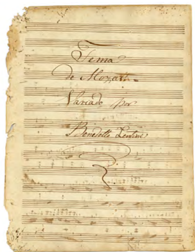
Tema de Mozart variado. Portada (ES 35001 AMC/MCC 049.026)

Del pianista, director y compositor Benito Lentini y Mesina (Palermo, 1793-Las Palmas de Gran Canaria, 1846) contamos en el archivo de El Museo Canario con cuatro obras autógrafas. Una de estas piezas musicales, el manuscrito del Tema de Mozart variado , nos servirá hoy como eje vertebrador de nuestro relato. De este modo, se convertirá en el punto de referencia a través del que conoceremos un poco mejor el Archivo de música y compositores canarios o relacionados con Canarias conservado en nuestro centro de documentación, colección documental que puede ser considerada, entre las de su tipo, una de las pioneras y más relevantes de las existentes en España.