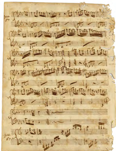
Tema de Mozart variado. Quinta variación [ES 35001 AMC/MCC 049.026]

en las variaciones siguientes. Tras la presentación de este motivo principal en do mayor y compás de 4/4, Lentini introdujo seis variaciones; las cuatro primeras y la sexta fueron escritas también en do mayor, mientras que la quinta –la más interesante a juicio de los especialistas– figura en do menor.