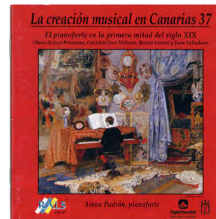
El pianoforte en la primera mitad del siglo XIX La creación musical en Canarias, 37