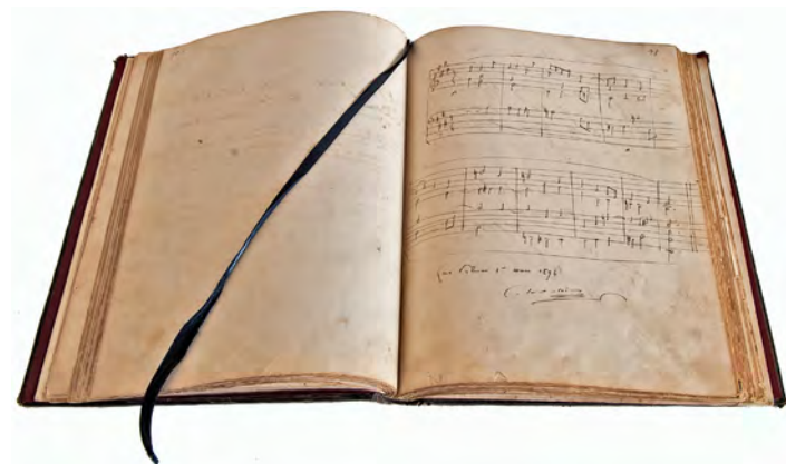
Dedicatoria en forma de partitura escrita por Camille Saint-Saëns (1894) Primer libro de firmas de El Museo Canario

Sin embargo, la historia archivística de la colección de partituras en la que se inserta la que nos ocupa, comienza en una fecha más temprana, coincidiendo su origen prácticamente con el de la fundación de la Sociedad Científica. Así, el manuscrito musical a través del que se inició la tradición de coleccionar este tipo de documentos no es otro que una dedicatoria, en forma de composición musical, que figura en el primer libro de firmas de visitantes ilustres del museo. Este singular saludo-partitura está firmado por Camille Saint-Saëns (1835-1921) en marzo de 1894 y fue escrito en el transcurso del segundo de los múltiples viajes que el compositor galo realizó a Gran Canaria. Este interesante autógrafo ha de ser considerado un exponente de la relación que el músico francés mantuvo con Canarias, hecho que justifica su presencia en nuestro archivo 2 .