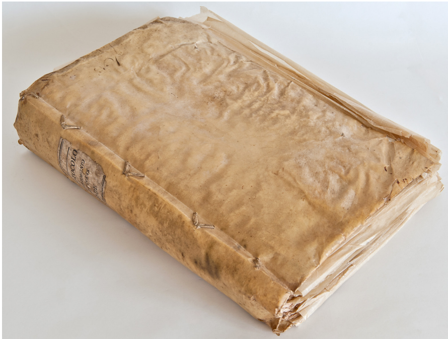
Archivo de El Museo Canario. Libro de protocolos de repartimientos de tierras año de 1542.

La incorporación de la isla de Gran Canaria a la Corona de Castilla el 29 de abril de 1483 introdujo una nueva concepción en el aprovechamiento del medio natural. Representó la aplicación de las leyes y usos que sobre la propiedad de la tierra y su explotación se habían establecido en Andalucía tras la conquista y ocupación de nuevos territorios por parte de Castilla. El instrumento fundamental de organización y legitimación de la propiedad es la figura del repartimiento: la distribución de lotes de tierras a conquistadores y pobladores que permite poner en rendimiento los recursos naturales.