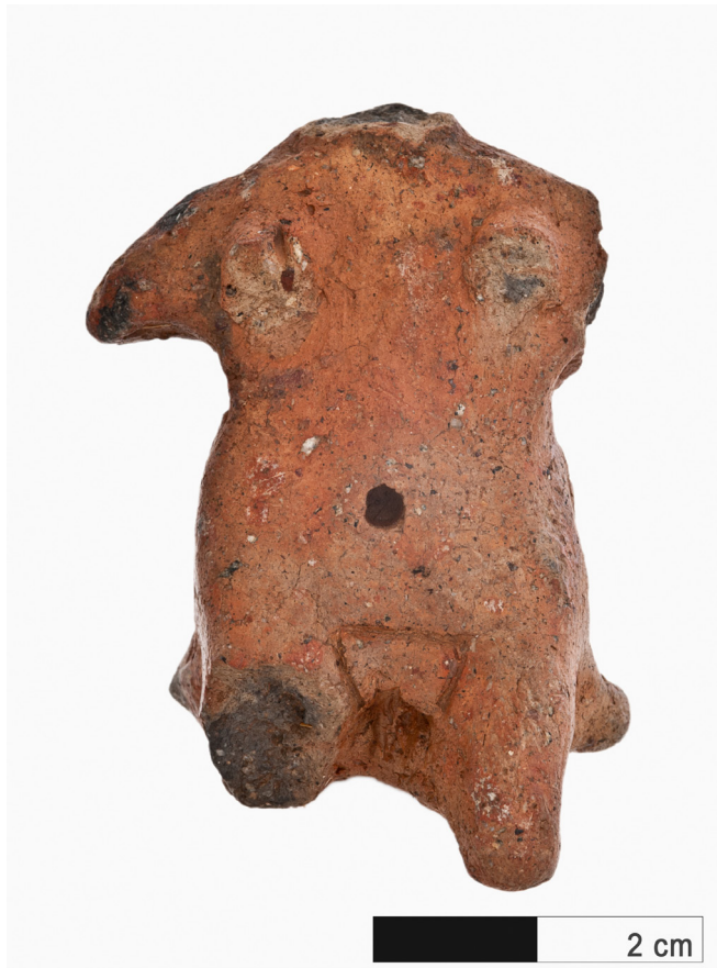
Figura humana femenina.

Entre los objetos elaborados en barro por la población prehistórica de Gran Canaria destacan los denominados “ídolos”. Estas esculturas aparecen con frecuencia en los contextos domésticos y suelen asociarse al mundo de las creencias y prácticas religiosas.