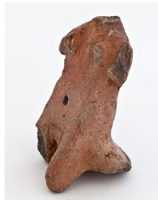
Detalle del soporte de sustentación.

En el caso que nos ocupa, además, las reducidas dimensiones de la escultura facilitan su manipulación y/o traslado, y su soporte de sustentación, localizado en su cara posterior, afianza su posición y reduce su apreciación a una visión frontal.