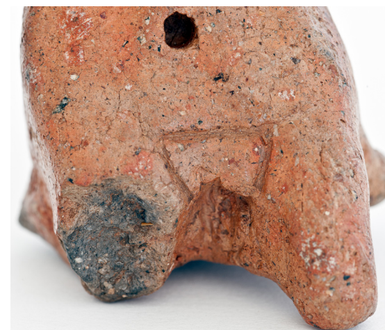
Detalle del triángulo púbico.