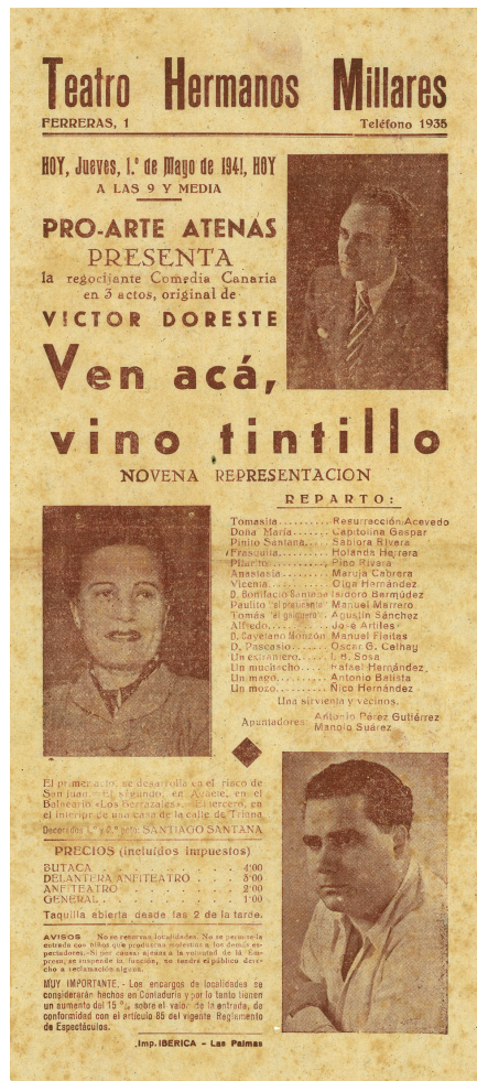
Suelto anunciador de la novena representación de Ve acá, vino tintillo , de Víctor Doreste Grande (ES 35001 AMC/VD-117)