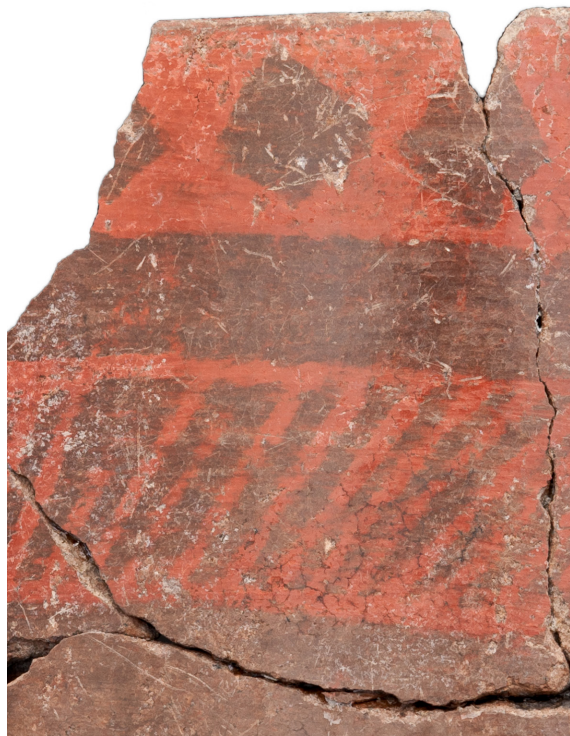
Detalle de los motivos decorativos