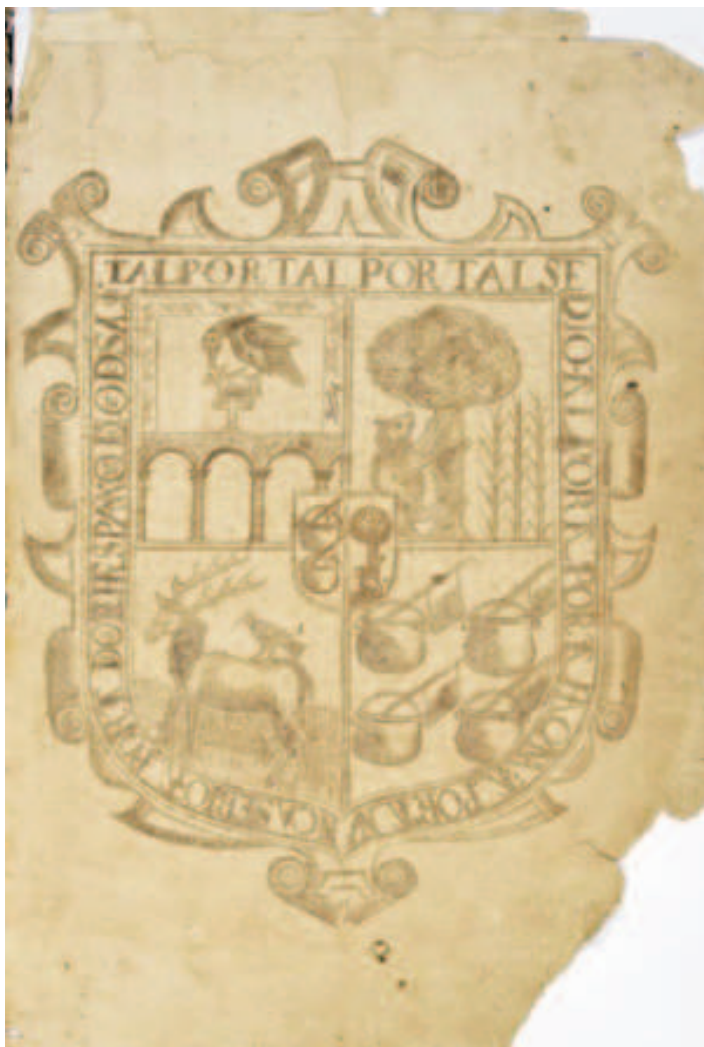
Libro rojo de Gran Canaria Escudo (folio 1)