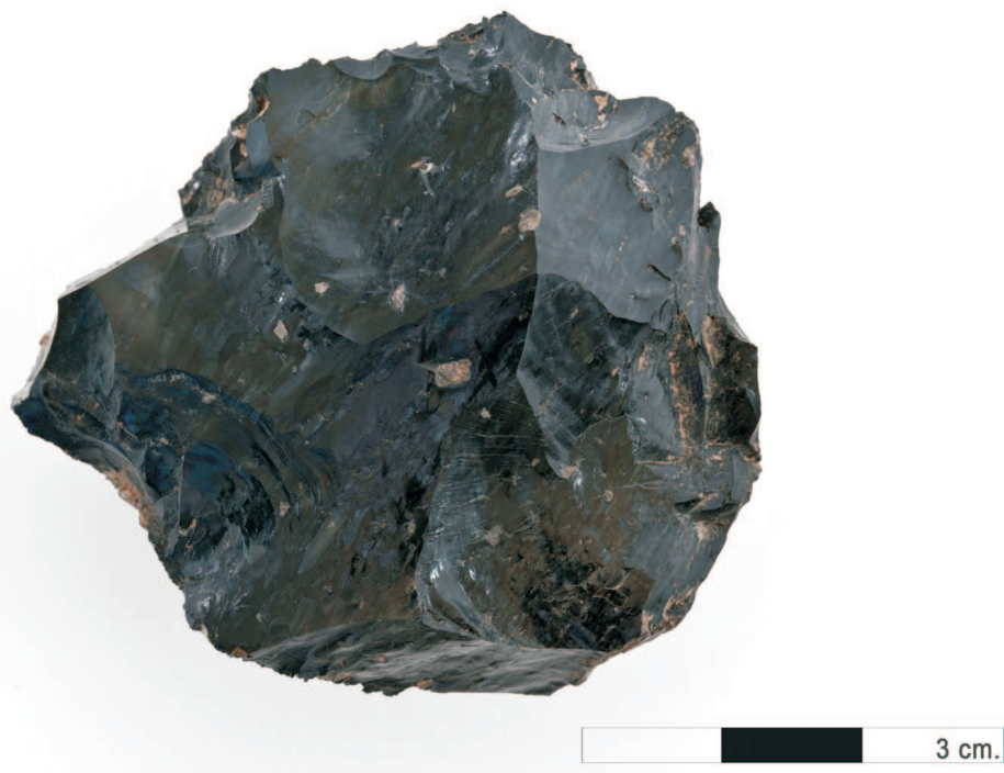
Núcleo de obsidiana