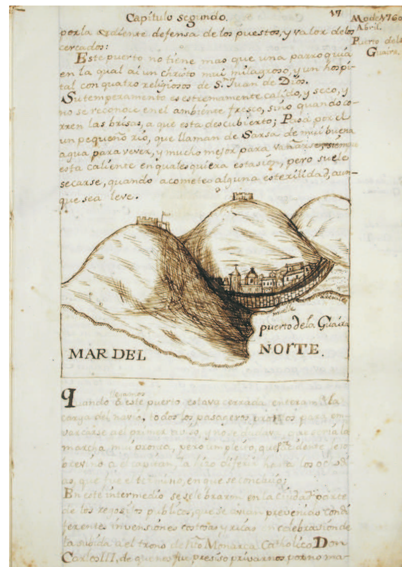
Representación del Puerto de la Guaira.

El diario, redactado en el último cuarto del siglo XVIII por Isidoro Romero Ceballos (1751-1816), regidor perpetuo del Cabildo de Gran Canaria, constituye uno de los originales del setecientos