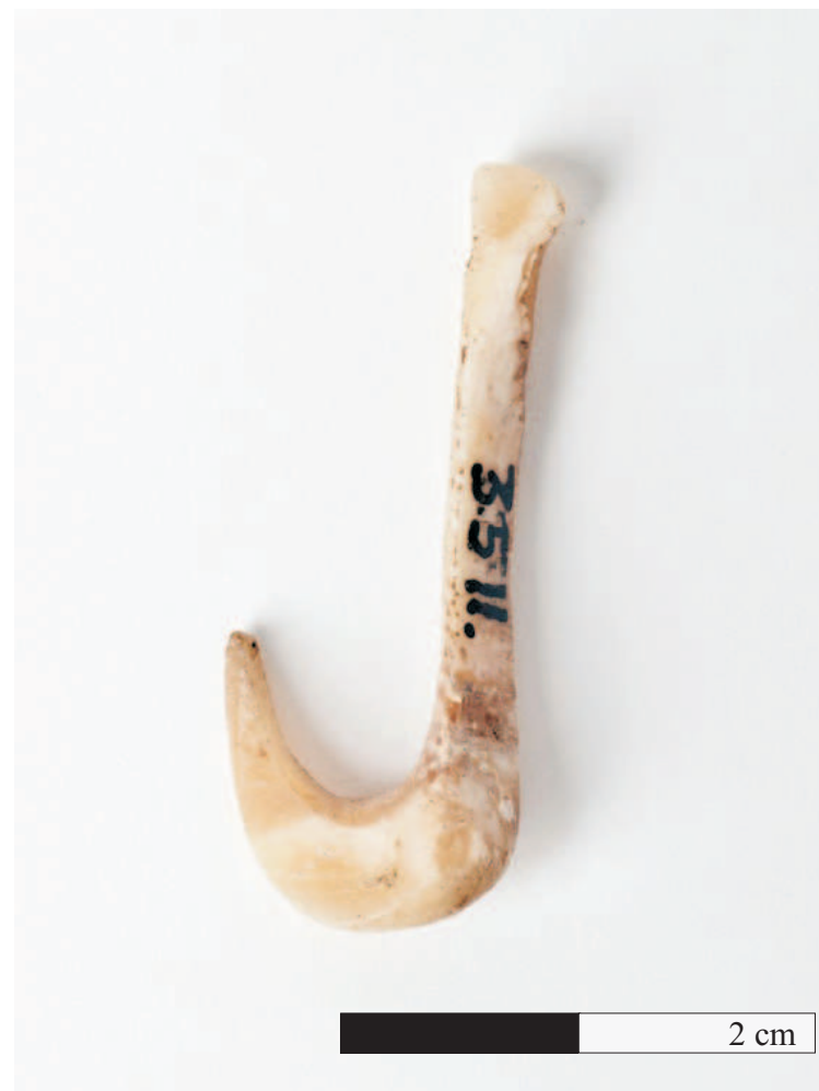
Vista posterior del anzuelo donde se aprecia el pulido de la curva.