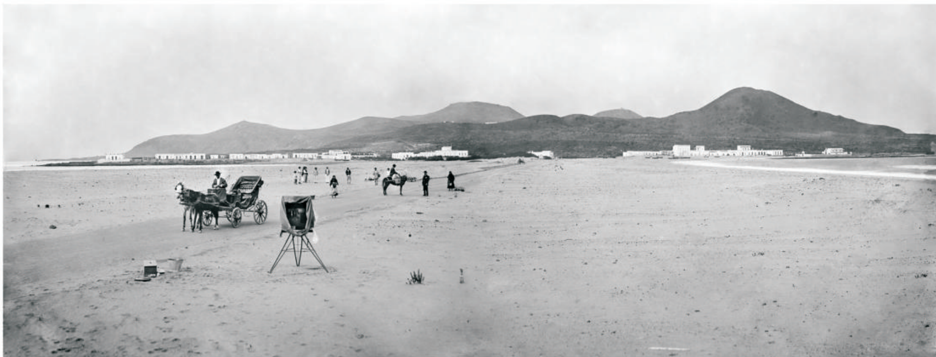
Vista panorámica de La Isleta y el istmo de Guanarteme, 1880 ca.