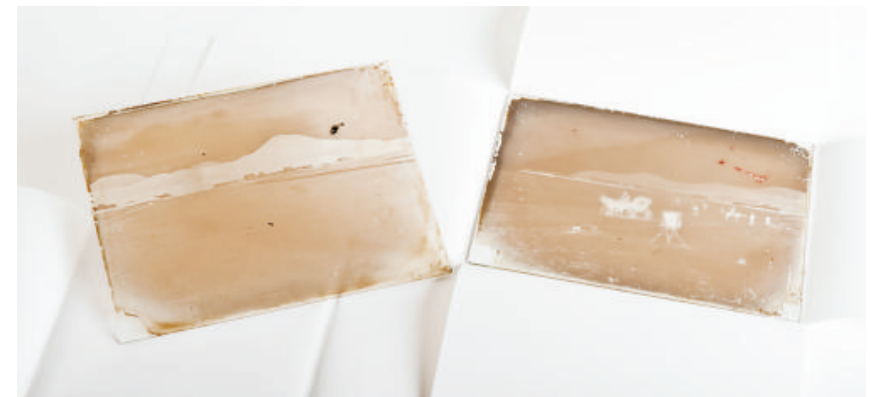
Placas negativas originales de vidrio de colodión húmedo; 18 x 24 cm.

Tratamientos de conservación y preservación realizados: Con fecha de 24 de enero de 2006 se procedió a la limpieza a nivel básico del objeto, consistente en la retirada de la suciedad superficial empleando un pincel de conservación de tipo suave y aplicando a continuación un algodón mojado con agua destilada sobre la zona contraria a la emulsión, secándola posteriormente y respetando durante toda la actuación las cartulinas adheridas y tintas utilizadas en su momento con funciones de enmascaramiento. Posteriormente se guardó en un sobre de cuatro solapas de papel permanente, depositándose en una caja de cartón de conservación libre de ligninas.