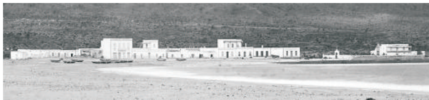
Detalles de la fotografía.