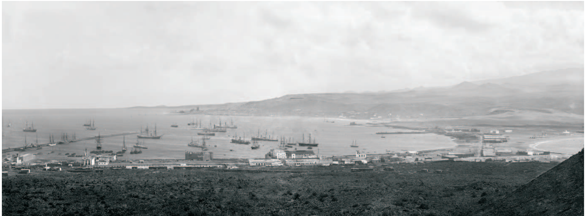
Vista panorámica del Puerto de La Luz y de Las Palmas, la playa de Las Canteras y los arenales, 1900 ca.