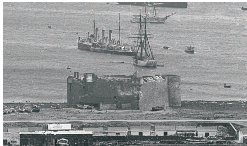
Detalle del Castillo de La Luz