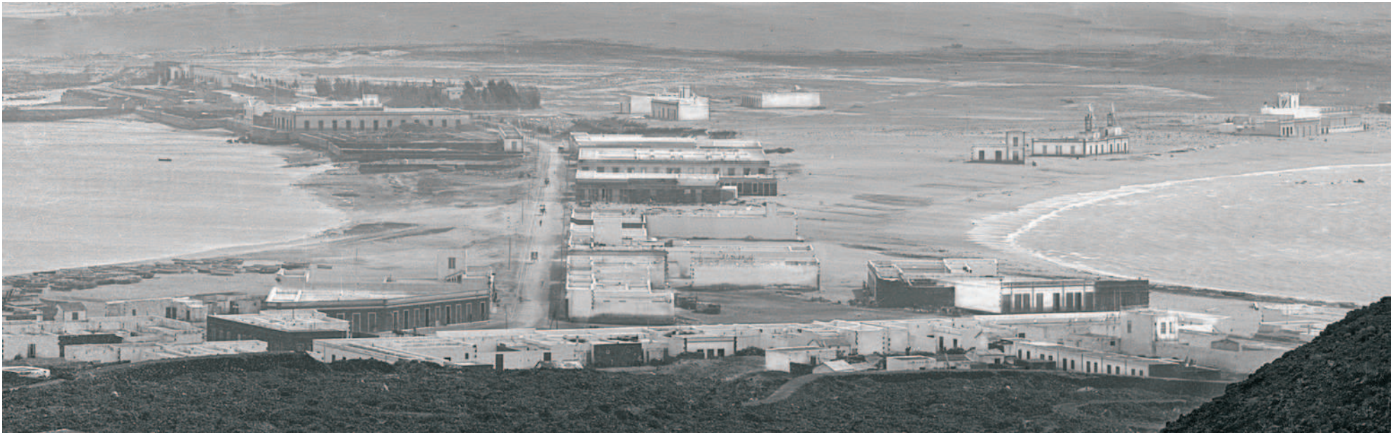
Detalle del istmo y playa de Las Canteras.