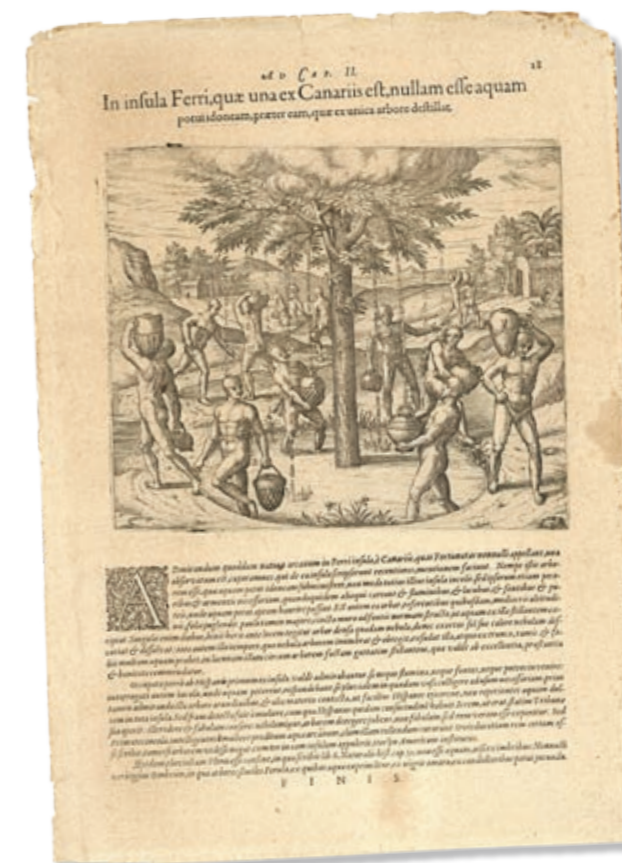
El árbol de El Hierro dibujado por Theodor de Bry, 1596.

y apariencia podrían corresponder, efectivamente, a un til notablemente frondoso, aunque su tamaño es menor que el que resulta de la descripción que pocos años más tarde haría Torriani, quien le atribuyó un tronco tan ancho que harían falta cuatro hombres para abrazarlo. El ejemplar del grabado, mucho más estrecho, tiene un tronco enhiesto, diferente del til retorcido que describiría el ingeniero cremonés.