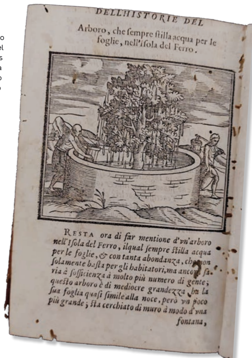
El Garoé según Girolamo Benzoni, 1572.

Pese a que Benzoni recoge en esta obra sus propios viajes por América, muy poco sabemos sobre su vida. Lo identificamos como milanés porque así consta en la portada, y como protestante (tal vez luterano) por sus críticas al paradigma católico con el que los españoles afrontaron su asentamiento en el nuevo continente. El autor publicó en 1565 una primera versión de su obra que ya incluía numerosos grabados para representar la vida de los indígenas de América y el Caribe, pero fue la edición de 1572 la que incluyó un capítulo final dedicado a las islas Canarias, insertando una xilografía más para mostrar el curioso árbol herreño. Nunca antes, que sepamos, se había hecho una representación gráfica del Garoé.