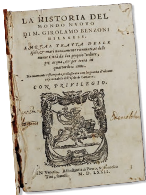
Historia del mundo nuovo. Biblioteca de El Museo Canario.

Por lo demás, solo una hoja, foliada con el número 177, falta en el libro, pero corresponde precisamente a la parte que trata de las islas Canarias, concretamente al relato de la conquista. Una anotación manuscrita, situada en la página de cortesía que sigue al final del texto, trata de subsanar esta mutilación completando, al menos, la frase que queda cortada en el lugar donde falta la página. Así, con caligrafía que podría corresponder a Baptista Odescalchi, se lee: «il principato della fortuna tristi et dolenti in Ispagna se ne tornarono», redondeando de esta forma el párrafo en el que se relata cómo fueron derrotados los hombres de Luis de la Cerda, que ya se hacía llamar príncipe de la Fortuna, en su intento de conquistar la Gomera, y cómo tuvieron que volverse a España tristes y dolientes.